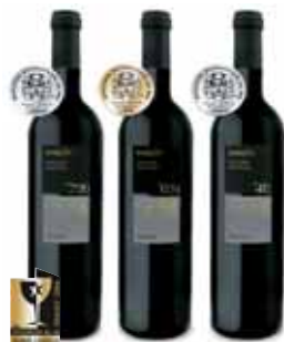
+720 כרם הר גורדים על גבול לבנון +624 כרם עלמה גליל עליון +412 כרם אבני איתו רמת הגולן

אלטיטיווד- מיני סדרה יחידה במינה, המשקפת את תמצית הפילוסופיה של היקב- אומנים ביצירת יין אדום. שלוש יצירות של קברנה סוביניון המייצגות שלושה ביטויים שונים ומרתקים של הזן, מאותה שנת בציר, מכרמים שונים בגבהים שונים. עם צאתה זכתה אלטיטיווד בהכרה עולמית ובמדליות בתחרות הבינלאומית בבורדו CHALLENGE INTERNATIONAL DU VIN שיא חדש ליין ישראלי. שיא חדש ליצירתיות.