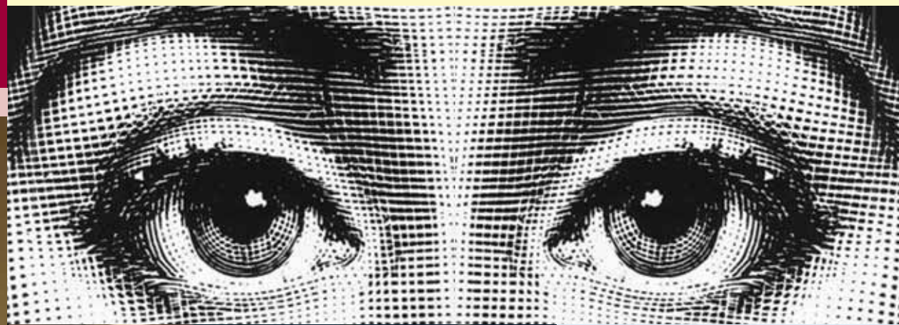
אברהם מור, אדיר מילר, אסנת פישמן